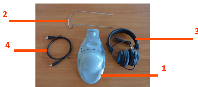
Ryc. 2 Urządzenie VisioClick® i jego akcesoria