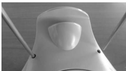
Ryc. 4 Instalowanie stojaka na zestaw słuchawkowy