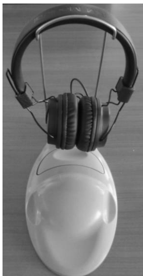
Ryc. 6 VisioClick® z zestawem słuchawkowym prawidłowo umieszczonym na stojaku