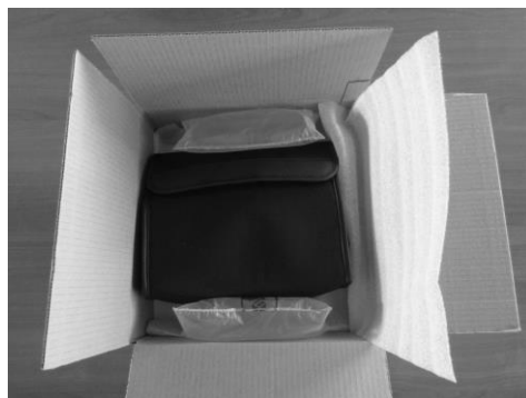
Figura 1 Deschiderea ambalajului original VisioClick®

Vă recomandăm insistent să păstrați ambalajul original VisioClick® în întregime pentru o operațiune ulterioară de mentenanță.