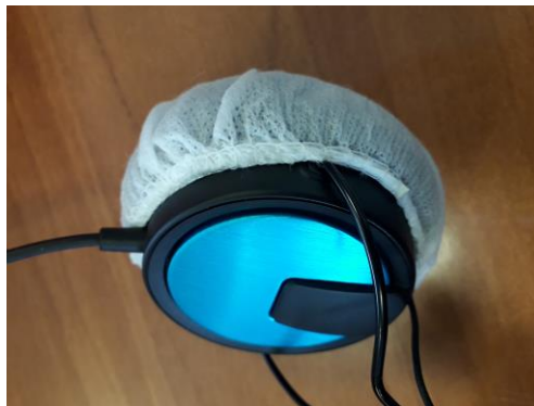
Figura 7 Montarea protecției igienice pe cupa căștilor