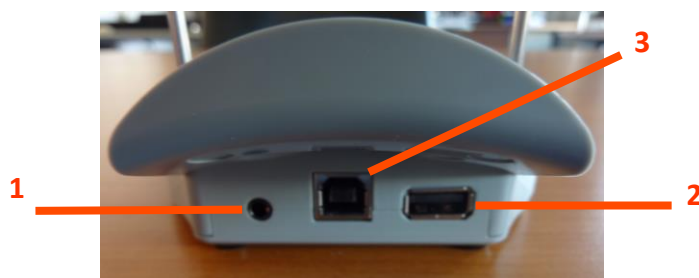
Figura 5 Vedere din spate - Suport de conectare