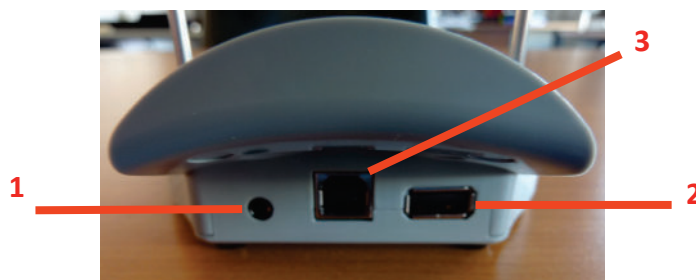
Εικόνα 5 Οπίσθια πλευρά - Συνδετικό στήριγμα