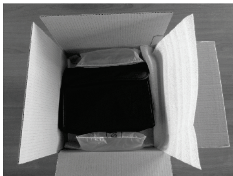
Εικόνα 1 Άνοιγμα της αρχικής συσκευασίας του VisioClick®

Σας συνιστούμε να διατηρήσετε την αρχική συσκευασία του Visiolite® ανέπαφη για μια μετέπειτα λειτουργία συντήρησης.