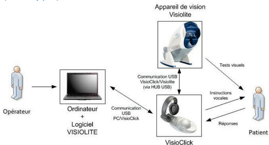
Εικόνα 3 Σχεδιάγραμμα του τρόπου λειτουργίας του VisioClick®