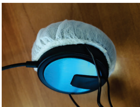
Εικόνα 7 Τοποθέτηση του σκουφακιού υγιεινής στο ακουστικό της κεφαλής