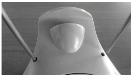
Εικόνα 4 Εγκατάσταση του στηρίγματος του ακουστικού κεφαλής