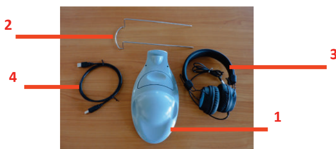
Εικόνα 2 Το VisioClick® και τα εξαρτήματά του